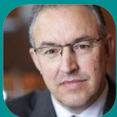
Dhr. A. Aboutaleb